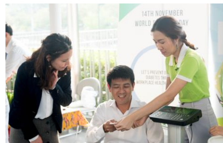
Marimo5 ブースで保健指導を受ける参加者

Marimo5 ブースではタニタ業務用体組成計を用いた健康測定とタイ人管理栄養士によるタイ食文化を踏まえた生活習慣病予防に役立つ保健指導がなされました。