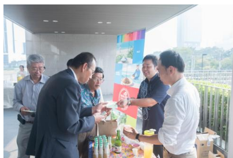
沖縄県庁ブースで試飲する参加者

休憩時にはセミナー参加者が各ブースを回るスタンプラリーが実施されました。沖縄県庁が出展したブースでは血糖値を下げる傾向がある沖縄特産販売株式会社のシークワサーが試飲と共に紹介されて多くの人が効果・効能の説明に聞き入りました。