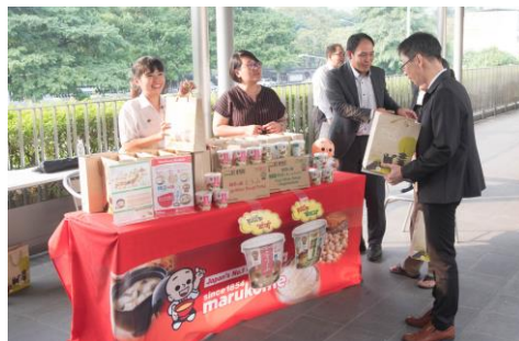
味噌カップスープを受け取る参加者

マルコメタイランドのブースでは日本の伝統的発酵食品である味噌が説明されると同時にタイで購入可能な味噌カップスープが多くの参加者に試供されました。